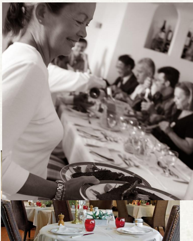
Le Grand Cabane Bar Restaurant